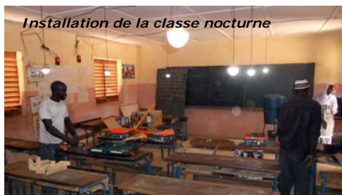
Installation de la classe nocturne

Après concertation avec l'école, la mairie et l'Académie, nous avons installé le matériel solaire apporté par une autre ONG à Ouèto (Benkadi), mais jamais installé. Ainsi, l'école a pu expérimenter les premiers aides aux devoirs dans la nouvelle « classe nocturne ».