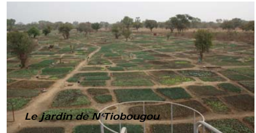
Le jardin de N'Tiobougou

d'assurer l'autonomie financière de la coopérative pour entretenir la clôture et l'irrigation du jardin.