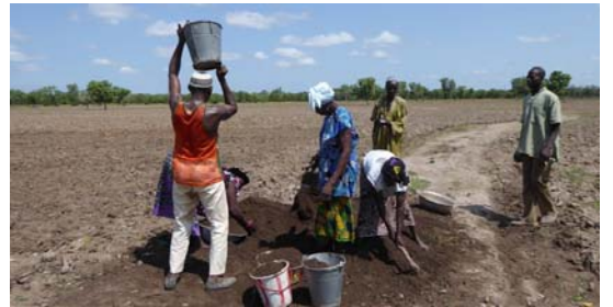
Formation pratique au compostage (Koureh)