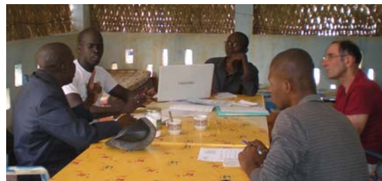
L'équipe ARCADE en séance de travail

Les missions au Mali ont eu lieu sur une période totale de 4 mois, fin 2017 et début 2018 (4 Administrateurs et notre Déléguée Générale). La sensibilisation des élus, le lancement de nouveaux projets et la poursuite du projet GM2i étaient, avec l'évaluation annuelle, les principaux thèmes de ces missions. Notre nouvelle équipe fonctionne bien, avec trois postes aux compétences complémentaires. Membres et élus français ont eu l'occasion de rencontrer deux d'entre eux lors de leur mission en France fin mars.