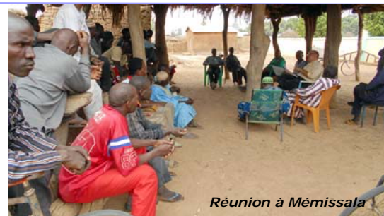
Réunion à Mémissala

Mémissala : Une nouvelle panne a motivé le comité à revoir son fonctionnement pour favoriser une plus grande consommation. Il a rédigé un nouveau règlement intérieur présenté par le bureau