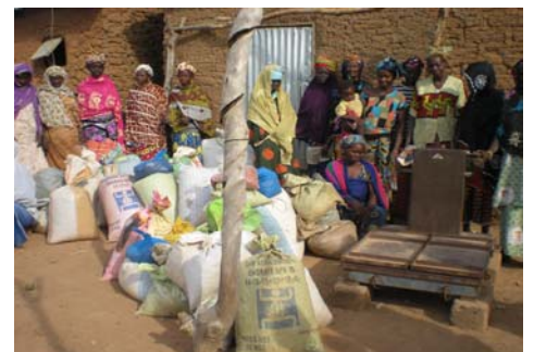
Pesée du piment séché

Malgré un démarrage tardif du à la réalisation de l'irrigation début 2017, les femmes ont réalisé des recettes individuelles de 500 € sur le maraîchage. Quand à l'association, elle est bénéficiaire de 709 € en 2017. Les femmes ont vendus 259 kg de piments séchés et espèrent augmenter cette production en 2018. La grande majorité d'entre elles n'utilisent que de la fumure organique. Elles ont aussi cultivé plusieurs parcelles collectives, sur lesquelles elles testent de nouvelles productions, pour les reproduire ensuite dans leurs parcelles individuelles. Cette association, très dynamique, souhaite associer la pisciculture au maraîchage pour diversifier ses activités.