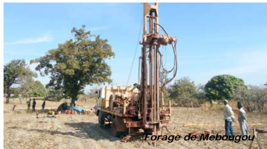
Forage de Mebougu

aux représentants du village, qui doit maintenant être validé par la population et la commune.