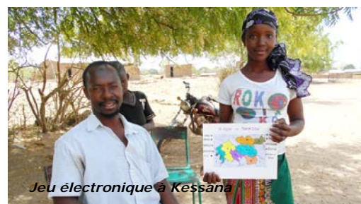
Jeu électronique à Kessana

Notre Commission Education a préparé de nombreux supports et conseils, en réponse aux demandes des enseignants de Benkadi. Mais en raison d'une grève générale des enseignants maliens début 2018, nous avons reporté la mission d'échanges pédagogiques. Les Editions Hatier continuent de nous fournir des manuels parascolaires, outils précieux pour compléter ce travail. Les Collèges de Kessana (Dembela) et de La Motte-Servevex ont commencé un échange entre enseignants et ont travaillé sur des jeux pédagogiques (jeu électronique et jeu de cartes).