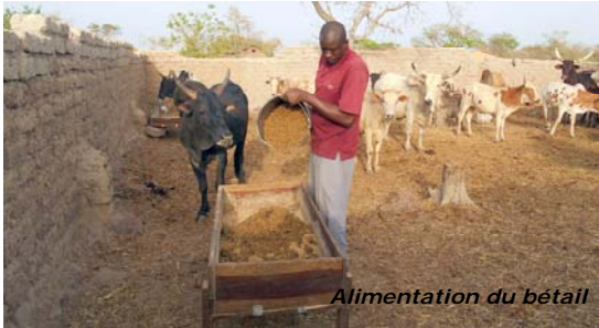
Alimentation du bétail