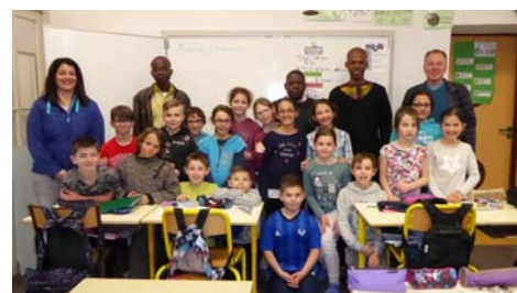
La délégation Malienne à l'école de La Chapelle Blanche

En 2017-2018, les échanges scolaires ont eu lieu entre les écoles françaises de Barraux, Saint-Maximin, Chamoux-sur-Gelon et La Chapelle Blanche et les écoles maliennes de Tella, Oueto (Benkadi) et Niamakouna (Blendio). L'élevage, l'habitat ou la culture ont été des thèmes d'échanges entre les élèves (à retrouver sur le blog !). En mars, les élèves français ont aussi pu poser leurs questions à la délégation malienne. A Chamoux les enfants ont fabriqué des bricolages avec l'aide de parents bénévoles vendus lors de la fête de fin d'année au profit des projets au Mali. Une belle action de solidarité !