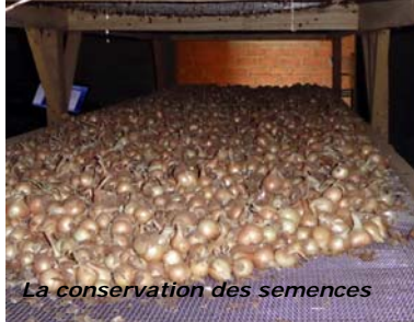
La conservation des semences

Cette année, les femmes ont diversifié leurs productions sur les 3 hectares, pour une recette supérieure à 6 000 €. L'échalote reste la production majoritaire avec 12 tonnes.