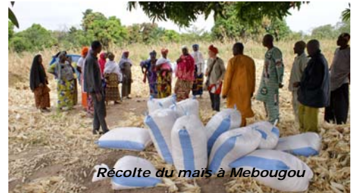
Récolte du maïs à Mebougou

A Mebougou (Dembela), après une année difficile due à des dissensions dans le village, les femmes ont su recouvrer tous les arriérés de cotisations. Dans le jardin, elles ont produit deux fois plus de maïs qu'en 2016, soit plus de 4 tonnes.