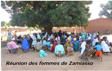
Réunion des femmes de Zamiasso