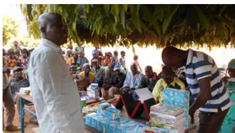
Distribution publique des fournitures