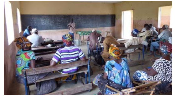
Formation théorique (Koureh)

Younouss poursuit le suivi de gestion et des productions, afin de les aider à trouver de meilleures solutions de commercialisation.