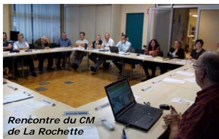
Rencontre du CM de La Rochette

Le Cheylas et Saint-Maximin maintiennent leur subvention annuelle, Pontcharra la diminue de 6 000 €, tandis que Crêts en Belledonne l'augmente de 300 €, La Chapelle Blanche de 700 €, La Rochette et Barraux de 1 000 € chacune.