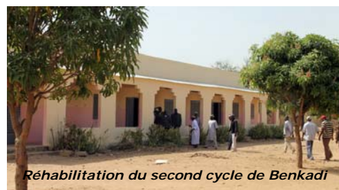
Réhabilitation du second cycle de Benkadi

Sollicitée et cofinancée à 5% par la commune de Benkadi cette réhabilitation a permis de sécuriser les 6 salles de classe, la direction et les latrines (toitures, huisseries et plafonds). Ainsi, une centaine d'élèves et d'enseignants ont repris sereinement les cours. La mairie de Benkadi a su en faire un bel exemple de partenariat et de transparence entre l'ARCADE, l'entreprise l'école et le village.