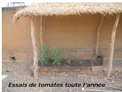
Essais de tomates toute l'année

Les essais de conservation des échalotes se poursuivent à N'Tiobougou, ainsi que la réflexion sur un bâtiment en terre, spécifique, pour la conservation de semences.