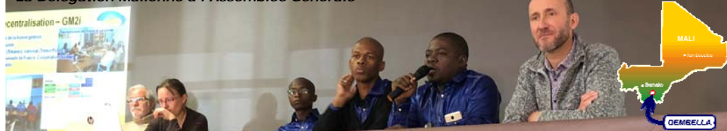
La Délégation Malienne à l'Assemblée Générale

Bonne lecture à tous et merci d'être à nos côtés. Votre soutien nous est précieux !