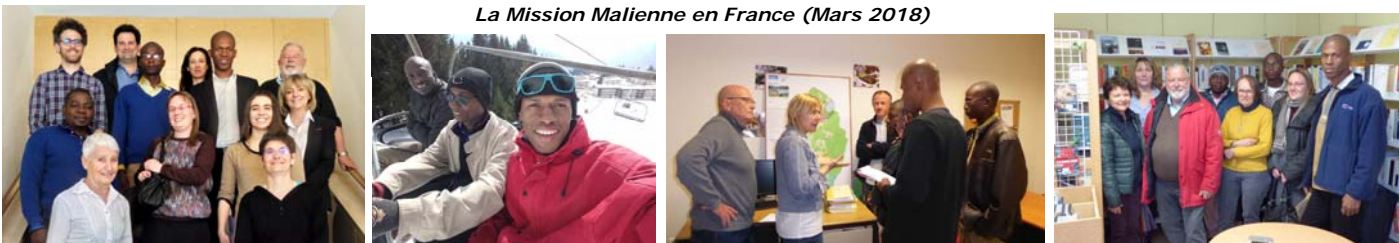
La Mission Malienne en France (Mars 2018)