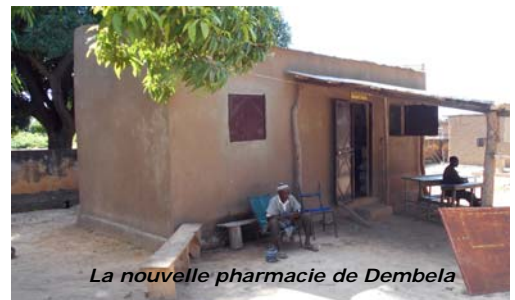
La nouvelle pharmacie de Dembela

Cette alerte a conduit la mairie à organiser une importante réunion avec les villages et le comité de gestion. Elle doit maintenant définir les suites à donner.